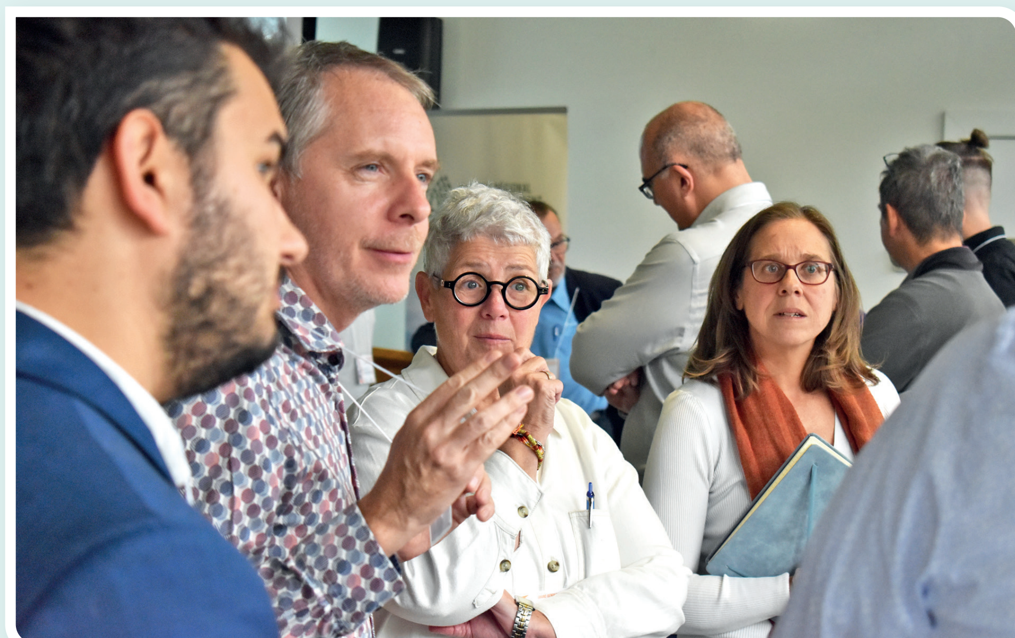
Photo prise lors du Grand rendez-vous de l'adaptation au climat